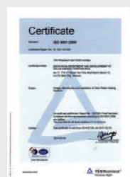
Tiêu chuẩn ISO 9001:2008