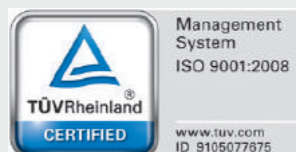
Chứng nhận TUV